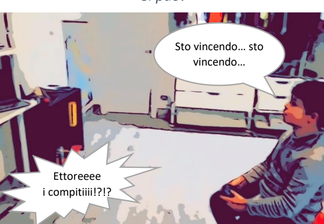
Spreco di tempo e...