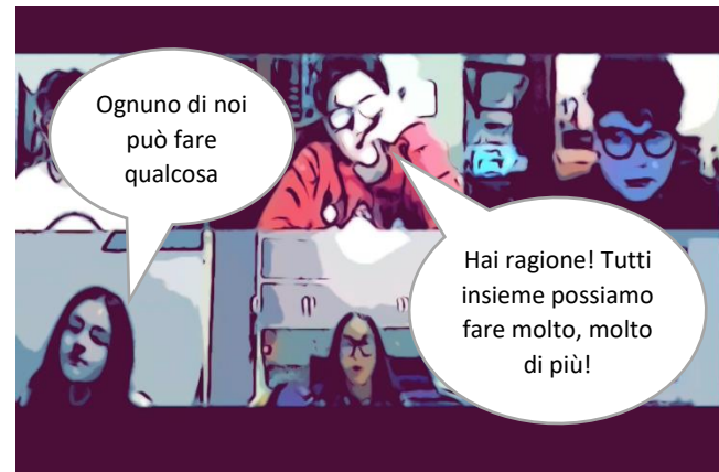
e cerchiamo una soluzione