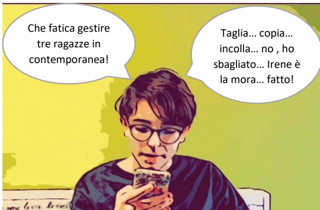
Riciclare messaggi per fare colpo?