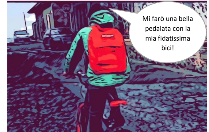
mens sana in corpore sano!