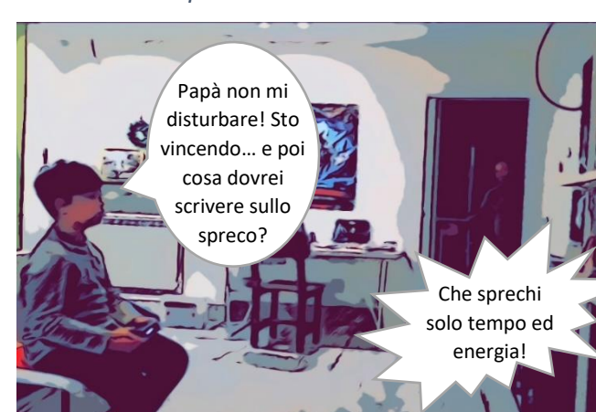
... di energia.