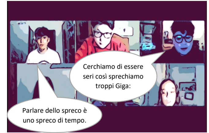
Riciclaggio e spreco: