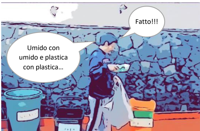
ogni rifiuto al posto giusto.