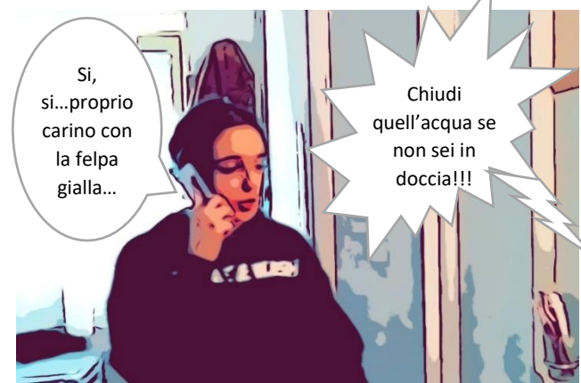
Spreco: Uso eccessivo...