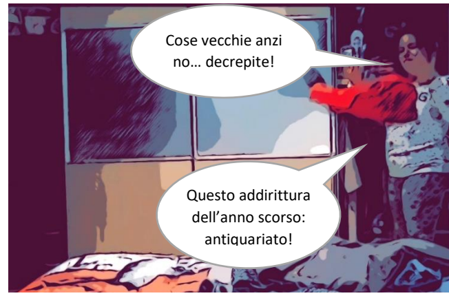
Il guardaroba: tutto da rifare!