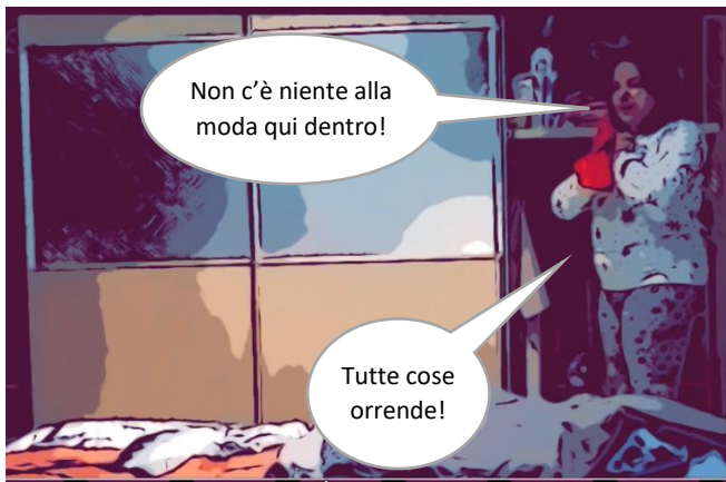
Spreco di denaro.